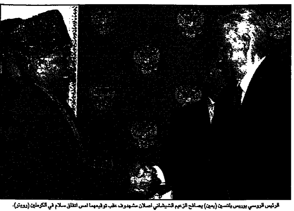
الرئيس الروسي بورييس يلسين (يمين) يصاحبه الزعيم الشيشاني اصلان شيفروف عقب توقيعهما امس اتفاق سلام في الكرملين

موسكو - من أناتولي فريين - وقع الرئيس الروسي بورييس يلسين والزعيم الشيشاني اصلان شيفروف امس الاتفاق سلام بحكم العلاقات بين روسيا وجمهورية الشيشان وبعد انتهاء صراع مسلح بين موسكو والجمهورية الانفصالية في شمال القوقاز على مدى 400 عام. وقال يلسين في مؤتمر صحفي في الكرملين ان اتفاق السلام يفتح صفحة جديدة في العلاقات بين روسيا والشيشان. وقال يلسين ان الاتفاق سلام يفتح صفحة جديدة في العلاقات بين روسيا والشيشان. وقال يلسين ان الاتفاق سلام يفتح صفحة جديدة في العلاقات بين روسيا والشيشان.